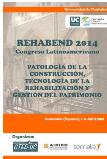
REHABEND 2014 (Libro de resúmenes ISBN: 978-84-616-8862-3) (Libro digital de artículos ISBN: 978-84-616-8863-0)