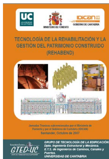
REHABEND 2007 (Libro de artículos) ISBN: 978-84-691-3612-6