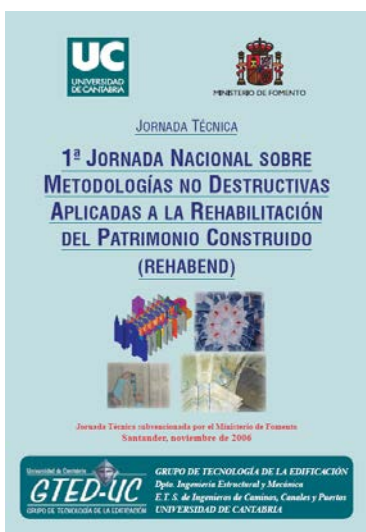
REHABEND 2006 (Libro de artículos) ISBN: 978-84-690-5269-3

Asimismo, es pretensión de la organización que en el año 2020 se celebre, por primera vez, en un país americano.