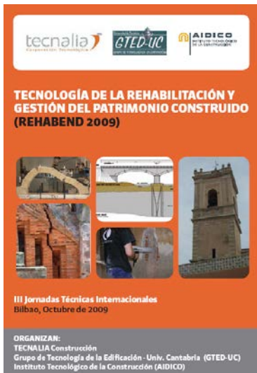
REHABEND 2009 (Libro de artículos) ISBN: 978-84-8873-404-4