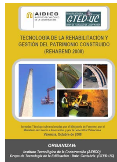
REHABEND 2008 (Libro de artículos) ISBN: 978-84-692-5650-3